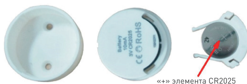
Рис. 1. Установка элемента питания.

Примечание. Если при нажатии на кнопку пульта индикатор не светится, замените элемент питания.